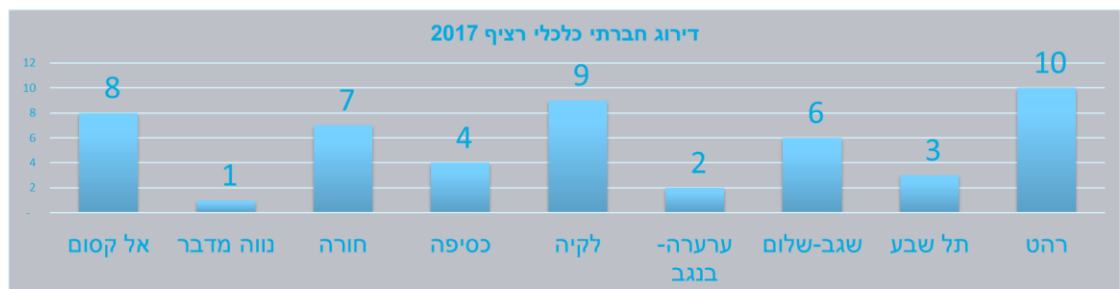
דרוג חברתי כלכלי רציף 2017 ( כלל הרשומים בישראל ) 1-255

כלל תושבי הרשויות הבדואיות משתייכים לאשכול כלכלי חברתי 1 ונמנים על תשע מתוך עשר המקומות הנמוכים בארץ בדרוג הכלכלי חברתי הרציף!